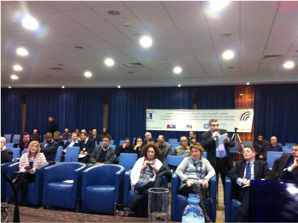
La salle du Congrès